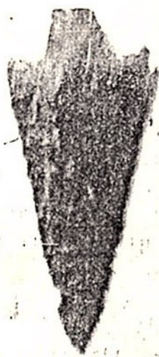
Une pointe de flèche.