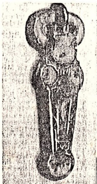
Une boucle de l'époque mérovingienne.